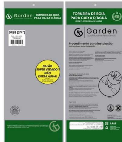
SACO PLÁSTICO INDIVIDUAL