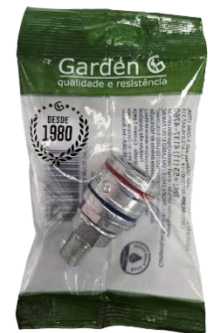
SACO PLÁSTICO INDIVIDUAL