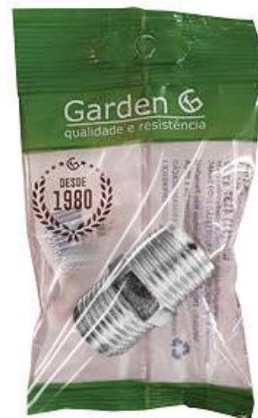
SACO PLÁSTICO INDIVIDUAL