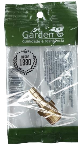
SACO PLÁSTICO INDIVIDUAL