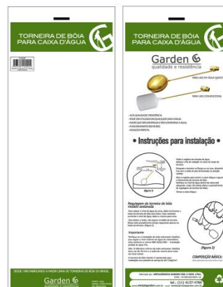
SACO PLÁSTICO INDIVIDUAL