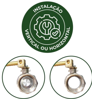
REGISTRO ESFERA PN25