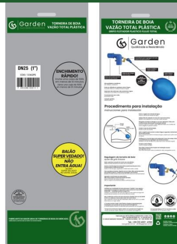
SACO PLÁSTICO INDIVIDUAL