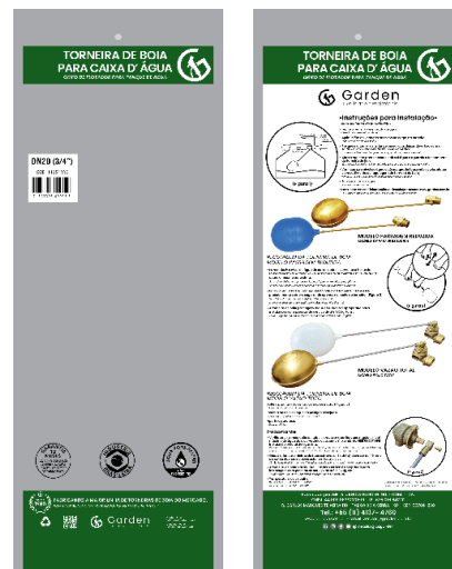
SACO PLÁSTICO INDIVIDUAL