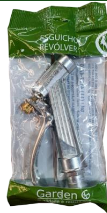
SACO PLÁSTICO INDIVIDUAL