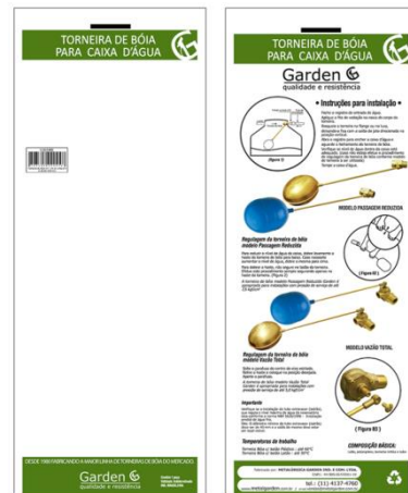
SACO PLÁSTICO INDIVIDUAL