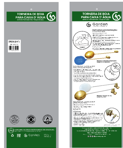
SACO PLÁSTICO INDIVIDUAL