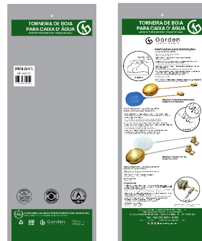
SACO PLÁSTICO INDIVIDUAL