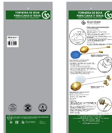
SACO PLÁSTICO INDIVIDUAL