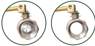
REGISTRO ESFERA PN25