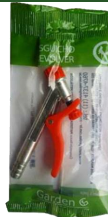
SACO PLÁSTICO INDIVIDUAL