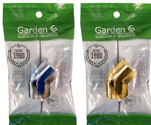
SACO PLÁSTICO INDIVIDUAL