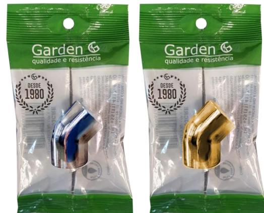
SACO PLÁSTICO INDIVIDUAL