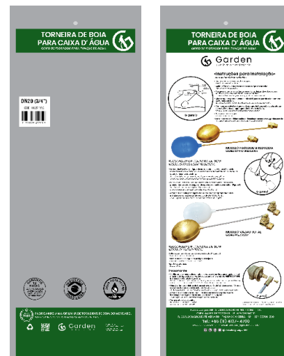
SACO PLÁSTICO INDIVIDUAL