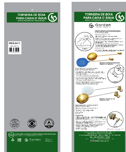
SACO PLÁSTICO INDIVIDUAL