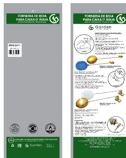
SACO PLÁSTICO INDIVIDUAL