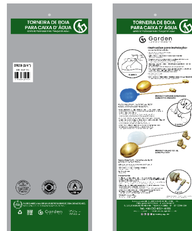
SACO PLÁSTICO INDIVIDUAL