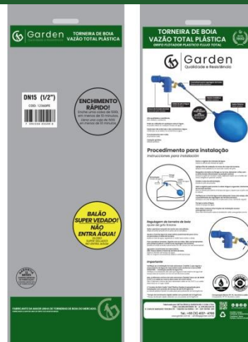
SACO PLÁSTICO INDIVIDUAL